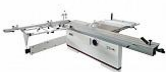
JET JTSS-3200X2 ФОРМАТНО-РАСКРОЕЧНЫЙ СТАНОК Артикул 1000062Т