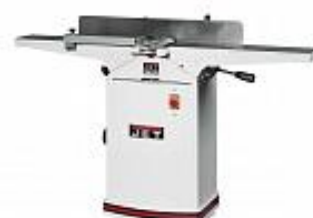
JET 54A ФУГОВАЛЬНЫЙ СТАНОК Артикул 179127М