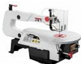
ЛОБЗИКОВЫЙ СТАНОК JET JSS-16A Артикул 10000808MA