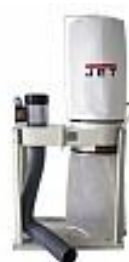
JET DC-900A ВЫТЯЖНАЯ УСТАНОВКА Артикул 10001051MA