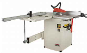
JET JTS-600XM ЦИРКУЛЯРНАЯ ПИЛА С ПОДВИЖНЫМ СТОЛОМ Артикул 10000070XM