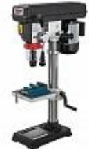
JET JDP-10VM НАСТОЛЬНЫЙ СВЕРЛИЛЬНЫЙ СТАНОК Артикул 10000430M