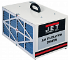
AFS-500 СИСТЕМА ФИЛЬТРАЦИИ ВОЗДУХА Артикул 708611М