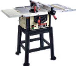
JET JBTS-10 ЦИРКУЛЯРНАЯ ПИЛА Артикул 708315М