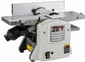
JET JPT-8B-M ФУГОВАЛЬНО-РЕЙСМУСОВЫЙ СТАНОК Артикул 707400М