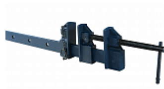
GROZ SBC/36 СТРУБЦИНА, 750ММ Артикул GR39112