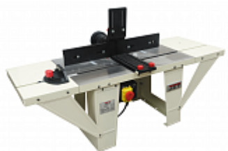
JET JRT-2 УНИВЕРСАЛЬНЫЙ ЧУГУННЫЙ ФРЕЗЕРНЫЙ СТОЛ Артикул 10000791М