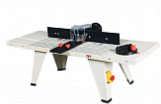
JET JRT-1 УНИВЕРСАЛЬНЫЙ ФРЕЗЕРНЫЙ СТОЛ Артикул 10000760М