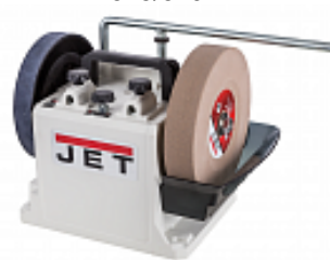
JET JSSG-8-M ШЛИФОВАЛЬНО-ПОЛИРОВАЛЬНЫЙ СТАНОК Артикул 10000409M