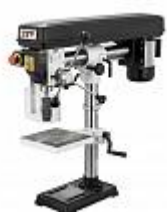
JET JDR-34 РАДИАЛЬНО-СВЕРЛИЛЬНЫЙ СТАНОК Артикул 10000390М