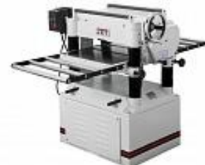
JET JWP-208-3 РЕЙСМУСОВЫЙ СТАНОК Артикул 708584T