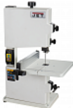
JET JWBS-8-M ЛЕНТОЧНАЯ ПИЛА Артикул 10000480M