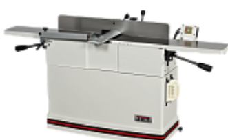
JET JJ-866 ФУГОВАЛЬНЫЙ СТАНОК 400 В Артикул 10000250T