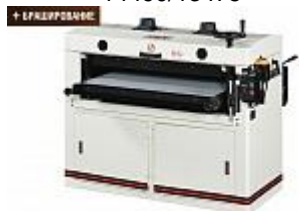
JET DDS-237 ДВУХБАРАБАННЫЙ ШЛИФОВАЛЬНО-КАЛИБРОВАЛЬНЫЙ СТАНОК Артикул 10000650Т