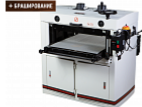
JET DDS-225 ДВУХБАРАБАННЫЙ ШЛИФОВАЛЬНО- КАЛИБРОВАЛЬНЫЙ СТАНОК Артикул 1791290T