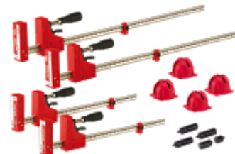
НАБОР КОРПУСНЫХ СТРУБЦИН И ПРИНАДЛЕЖНОСТЕЙ Артикул 70411EU