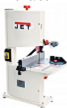
JET JWBS-9X ЛЕНТОЧНОПИЛЬНЫЙ СТАНОК Артикул 10000860M