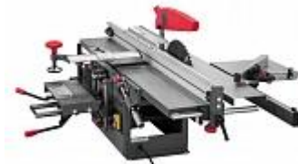
JET JKM-300 КОМБИНИРОВАННЫЙ СТАНОК Артикул 10000880М