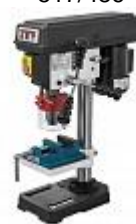
JET JDP-8VM НАСТОЛЬНЫЙ СВЕРЛИЛЬНЫЙ СТАНОК Артикул 10000400M