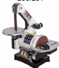
JET JDBS-5-M ТАРЕЛЬЧАТО-ЛЕНТОЧНЫЙ ШЛИФОВАЛЬНЫЙ СТАНОК Артикул 10000470M