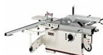
JET JTSS-1600X2 ФОРМАТНО-РАСКРОЕЧНЫЙ СТАНОК Артикул 10000065T