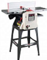
JET JPT-10B ФУГОВАЛЬНО-РЕЙСМУСОВЫЙ СТАНОК Артикул 707410М