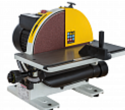
JET JDS-12X-M ТАРЕЛЬЧАТЫЙ ШЛИФОВАЛЬНЫЙ СТАНОК Артикул 10000490M