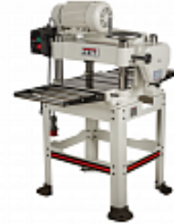
JET JWP-16 OS HH РЕЙСМУСОВЫЙ СТАНОК 400 В СО СТРОГАЛЬНЫМ ВАЛОМ "HELICAL" Артикул 708531T-RUHH