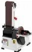
JET JSG-64 ТАРЕЛЬЧАТО-ЛЕНТОЧНЫЙ ШЛИФОВАЛЬНЫЙ СТАНОК Артикул 10000890M